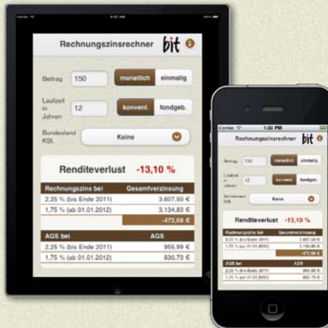
Medienbeispiele Portlet für Portal, Tablet PC und SmartPhone